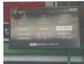
検査ラインシステムのモニター