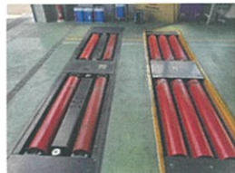
コンビネーションテスター