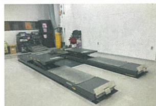
マルチアライメントリフト