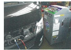
フロンガス交換機