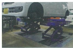
ファンタスリフト