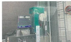
ヘッドライトテスター