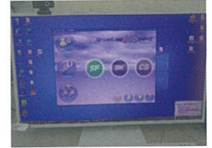
OSS対応ソフトウェアの画面表示