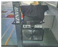
ヘッドライトテスター