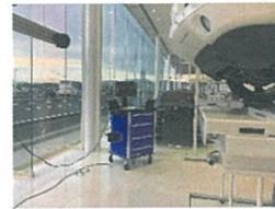
光学式アライメントテスター