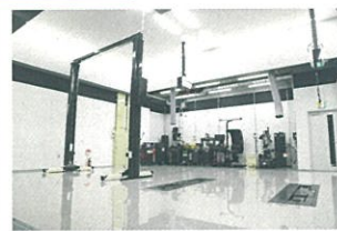
ホイールバランサー