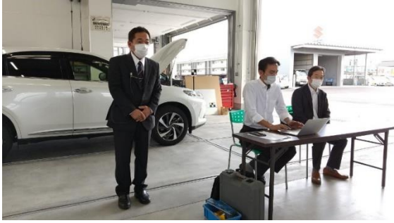
吉本支部長 開会挨拶