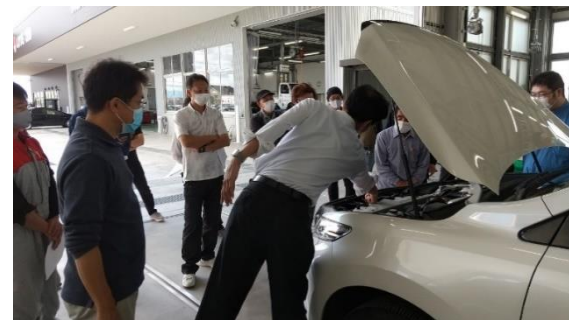
フロントカメラ・ミリ波レーダー光軸調整