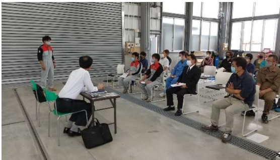
尾山副支部長 閉会挨拶