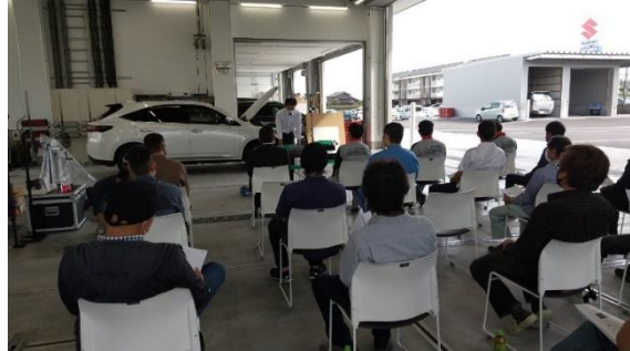
島田委員長による講義