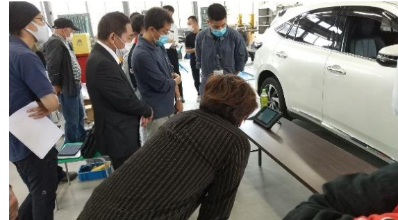
オーテル社エーミング実演